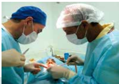
Corsi durante la live surgery.

Tutti possono apprendere una tecnica chirurgica con un'adeguata curva di apprendimento. L'importante è sapere perché si usa l'una o l'altra tecnica.